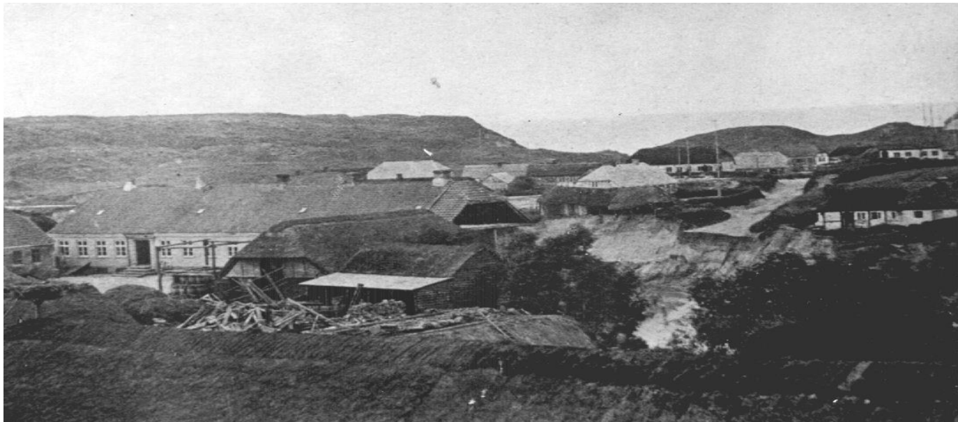
Foto: August 1877. Til venstre i forgrunden A.R. Segelckes gård, i midten Strandvejen som blev revet midt over. Til højre Bækhuset, M. Kablesvej 64. Bagerst til højre skimtes skudehandlerens pakhus