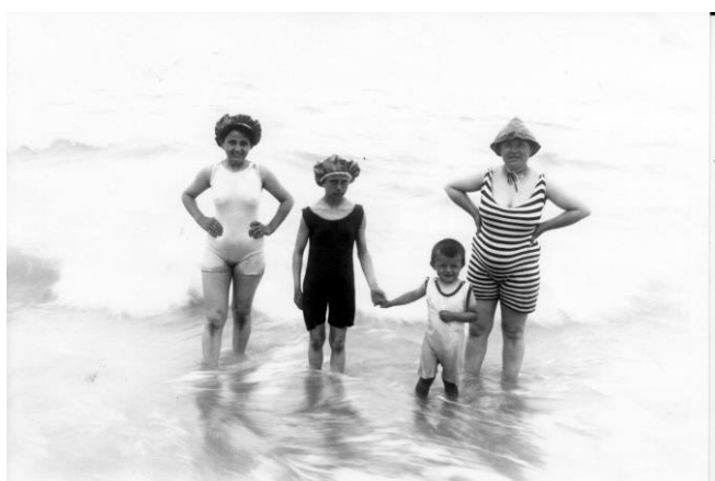
2. august 1892

"Det synes at blive almindeligere med badning her på kysten, ved Lønstrup ligger således flere lang vejs fra komme gjæster, og forholdene tillade badning selv ved hård strøm af pålandsvind. Det er uden for al tvivl, at Lønstrup, når der blev gjort endog kun det nødvendigste til et større antal gjæsters bespisning, egner sig langt bedre til badested end til eksempel Hjerting og Fanø, hvor ebbe og flod medføre nødvendigheden af kostbare apparater til de badende, end her på vor frie vestkyst.