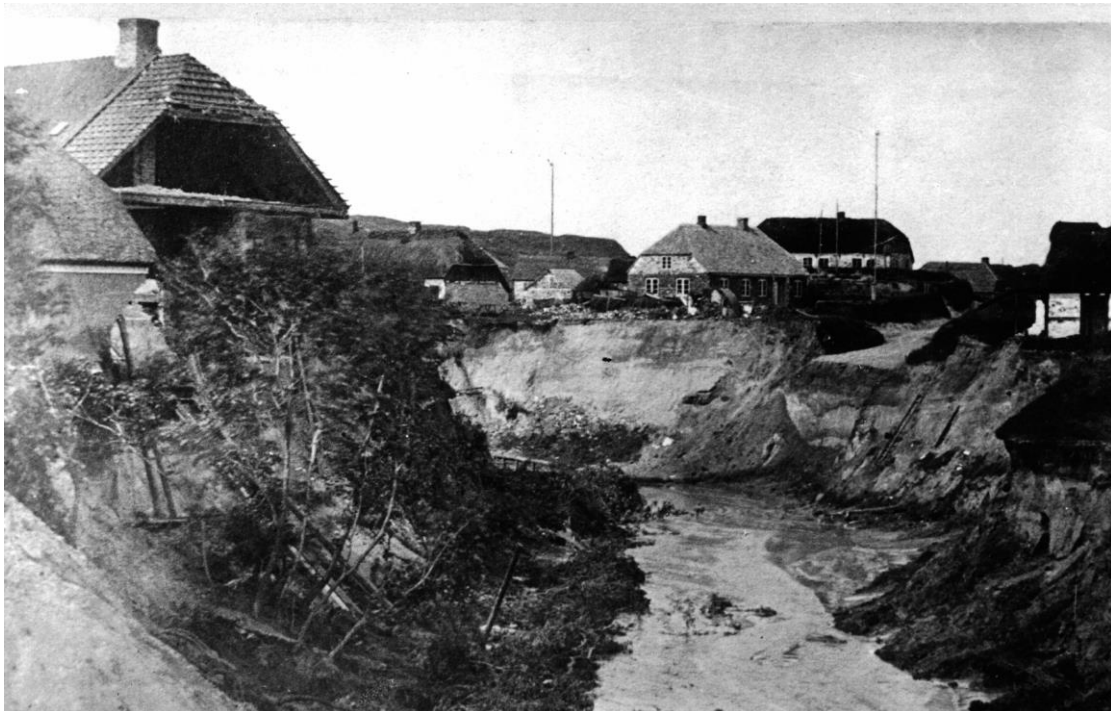
Foto 1877: Bækslugten efter katastrofen den 11. august. Til venstre A. R. Segelckes gård. Til højre Bækhuset, M. Kabelsvej 64.

En landsindsamling til fordel for de skadelidte blev iværksat. Katastrofens omtale i landets aviser var medvirkende til, at folk strømmede til Lønstrup for at se ødelæggelserne. Naturen havde taget det første skridt til at gøre Lønstrup til en kendt badeby.